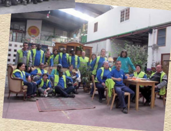
8. AÑO 2012. SOMOS MÁS DE 200 Y TRABAJAMOS EN 13 MANCOMUNIDADES DE AYUNTAMIENTOS DE TODA NAVARRA