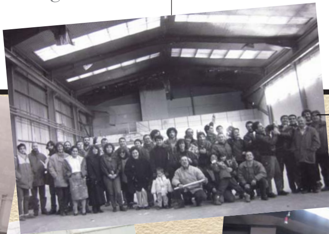
6. ADQUISICIÓN DE LA NAVE DE SARASA. 1995