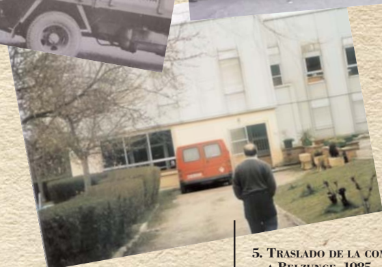
5. TRASLADO DE LA COMUNIDAD A BELZUNCE. 1985