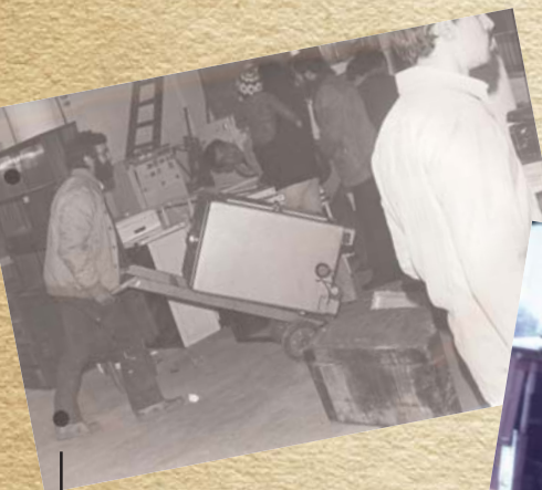
1. COMIENZA LA ACTIVIDAD DE TRAPEROS EN NAVARRA. Semana Santa 1972. En la campaña "Danos lo que te sobre", 200 jóvenes voluntarios recogen objetos por las casas para el primer Rastro en Intendencia, con destino al Poblado de Santa Lucía