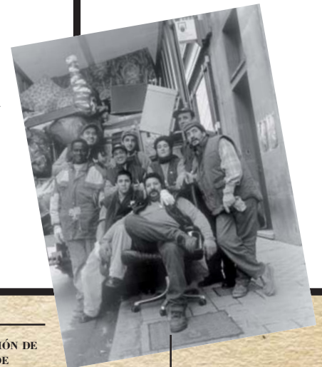
7. SEGUIMOS TRABAJANDO Y CRECIENDO. 2000