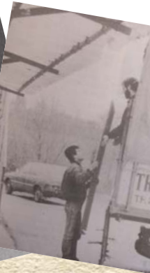
4. PRIMER CONVENIO CON EL AYUNTAMIENTO DE PAMPLONA PARA LA RECOGIDA DE VOLUMINOSOS. 1985