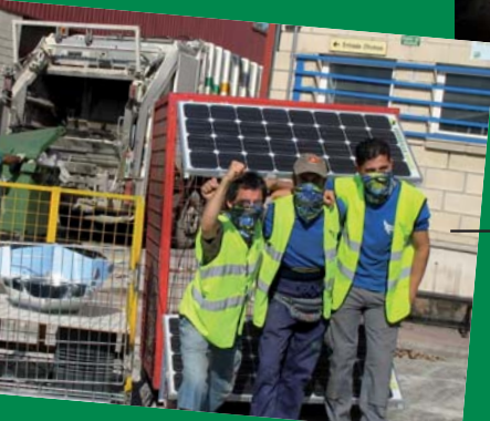
6. APOYO A LA CAMPAÑA GUERRILLA SOLAR, SARASA 2009