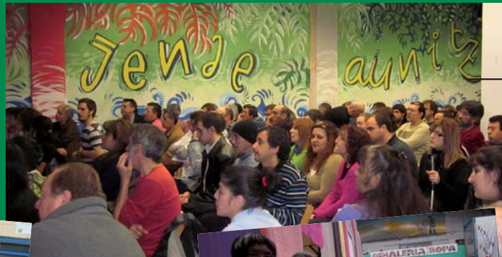
7. ASAMBLEA ANUAL DE TRAPEROS NAVARRA 2011 EN PAMPLONA