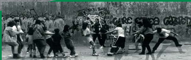
4. JORNADA EN EL GAZTETXE DEL DESAPARECIDO FRONTÓN EUSKAL JAI EN PAMPLONA, MAYO 1997