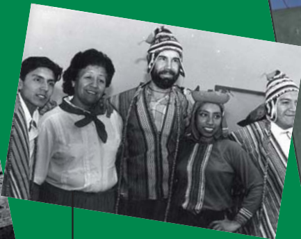
2. VISITA DE TRAPEROS DE PIURA, 1996