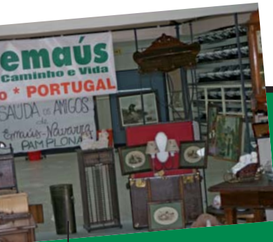
5. VENTA SOLIDARIA CON LA COMUNIDAD EMAÚS OPORTO, 2009

Las comunidades de Emaús son un testimonio práctico de ese mensaje: focos de resistencia, espacios de lucha y liberación desde la acogida, el trabajo, la vida en común, el servicio y la lucha.