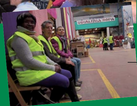
8. JORNADA DE PUERTAS ABIERTAS EN SARASA, ABRIL 2012