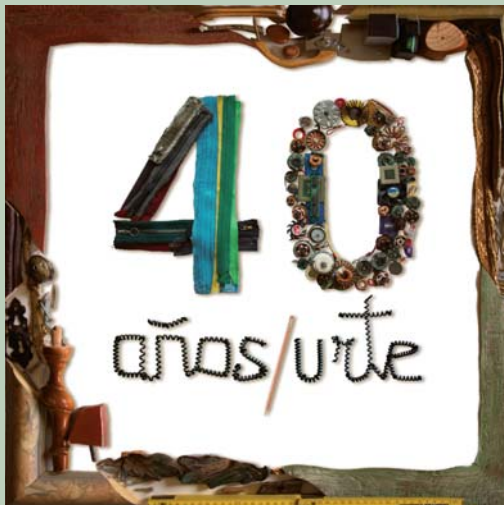
Imagen realizada con objetos reciclados de Traperos