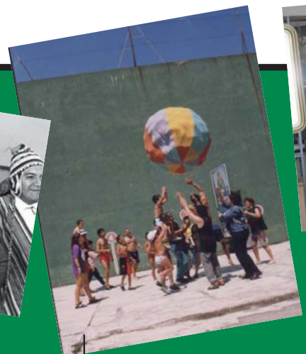
3. FIESTA EN LA COMUNIDAD DE BELZUNCE