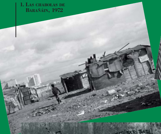
1. LAS CHABOLAS DE BARAÑÁIN, 1972