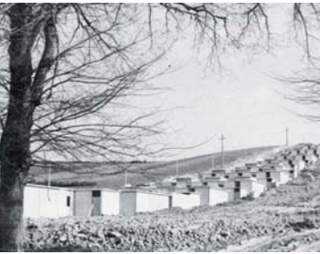
POBLADO DE SANTA LUCÍA, 1974