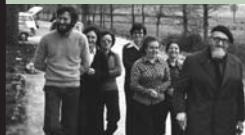
EN PAMPLONA, 1975

En el París de la posguerra, de las desigualdades y la miseria extrema, la muerte por frío de una mujer desahuciada de su casa fue el detonante de su “Insurrección de 1954”, un grito de rabia y cólera que llamó a la sociedad a rebelarse contra la injusticia y que puso en el primer plano de la opinión pública la realidad de marginación y desigualdad en una Europa que estrenaba los supuestos de libertad, derechos y democracia.